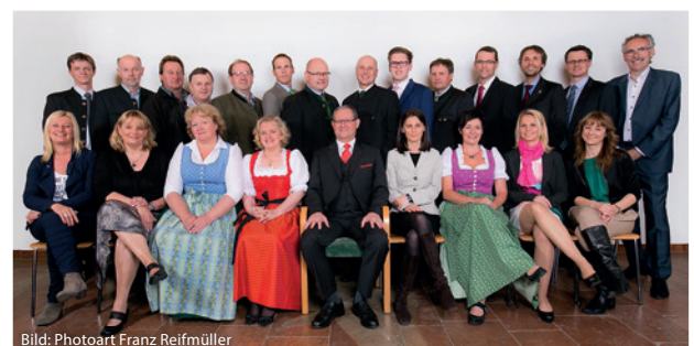
Die 2014 gewählten Mitglieder der Gemeindevvertretung.