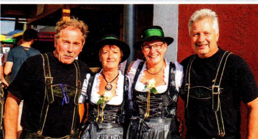
Rückten beim Mittersiller Stadtfest in ihrer Tracht aus: Die Mitglieder des Knappenvereins Mittersill.