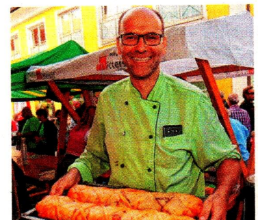
Mmmhhh! Die Strudelwirte punkteten mit großer Vielfalt!