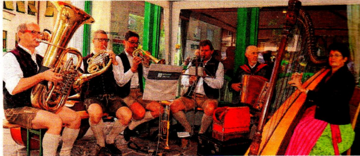
Auch die musikalische Umrahmung durfte beim Strudelfest nicht fehlen, hier die „Maishofner Tanzmusi“.