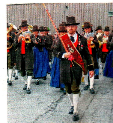
Die Trachtenmusikkapelle eröffnete das schöne Fest.