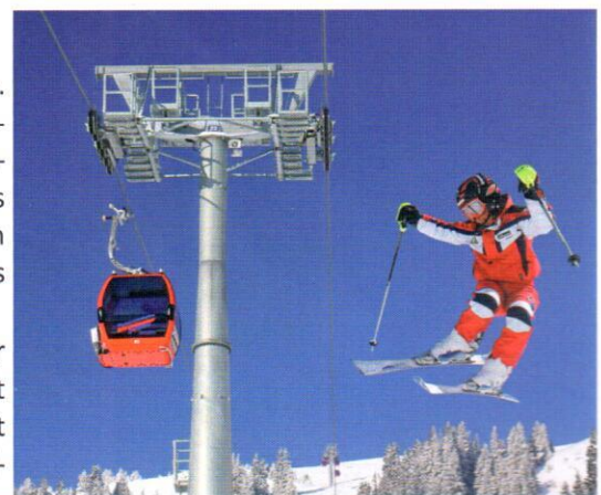
finanzielle Entlastung der Familien durch Schülermenüs

Durch die Unterstützung der Hüttenwirte wird der Schisport für Familien leistbarer und somit vielleicht auch wieder für heimische Kinder attraktiver. Unbestritten haben die Mittersiller Hüttenwirte ein besonderes Herz für Kinder - Danke dafür! (Eine Liste der teilnehmenden Schihütten finden Sie