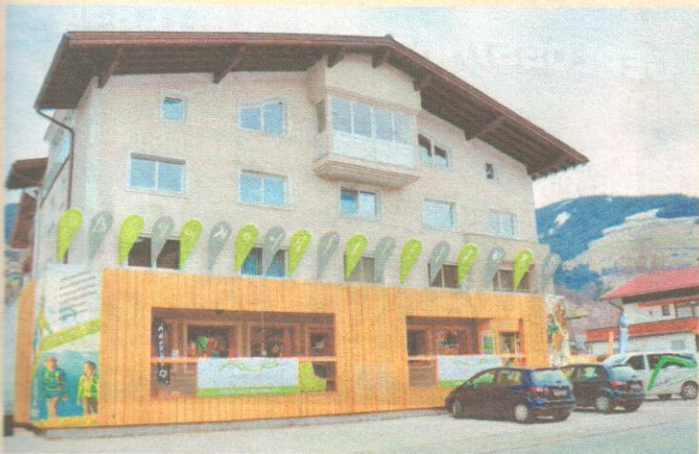
Holz ist das dominierende Element in der Shopgestaltung.

Bereits ab Montag, dem 25. März, hat der Shop geöffnet. Die offizielle Eröffnung findet am Samstag, 30. März, statt. Öffnungszeiten: Mo.-Fr.: 9-18 Uhr, Sa.: 9-12 Uhr. Infos: www.alp-store.at