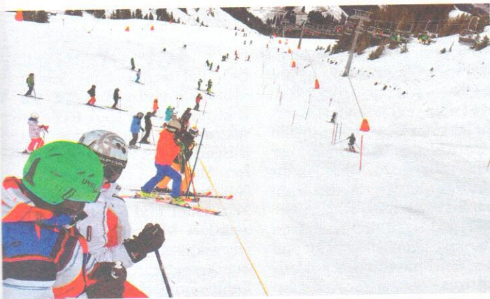
Unter den Augen zahlreicher Skifans nutzen diverse Weltcup-Teams die perfekten Bedingungen am Resterkogel zum Training.