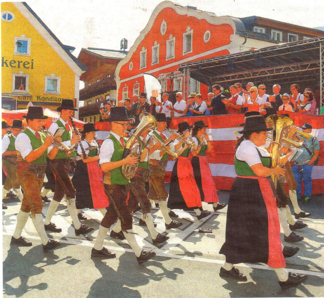
Die Musikkapellen der Region gaben Mittersill die Ehre, begleiteten die Feldmesse und sorgten beim Marsch durch die Stadt für Begeisterung bei den Ehrengästen und Besuchern.