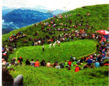
Die traumhafte Kulisse beim Statzerhaus.