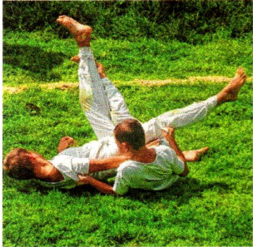
Die Jüngsten kämpften um den begehrten Titel.