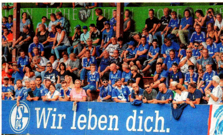
Die Schalke Fans belagerten die ganze Woche die Tribünen in Mittersill. Mehr Fotos auf www.meinbezirk.at