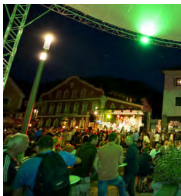
Herrliche Stimmung herrschte beim Stadtfest – eine rundum gelungene Veranstaltung.