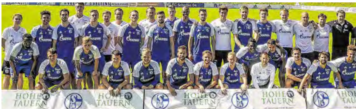
Der Schalke-Tross freute sich über beste Bedingungen am Mittersiller Sportplatz.