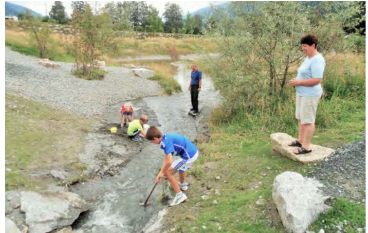
Das Areal lädt zu Spiel und Spaß ein.

Auch der Bevölkerung soll es ein Erholungsgebiet sein. Kinder haben die Möglichkeit, sich beim Sandspielen, Stau-mauerbauen oder dergleichen auszutoben. Zudem wurde der Burkbach seitlich mit einem Rohr ausgeleitet, um ein kleines fließendes Gewässer zu erhalten. Walter Pfeiffer, Obmann der Wildbachgenossenschaft Burkbach, sagt: „Ein großer Dank gebührt dem Land Salzburg / Gewässerabteilung, im besonderen Herrn