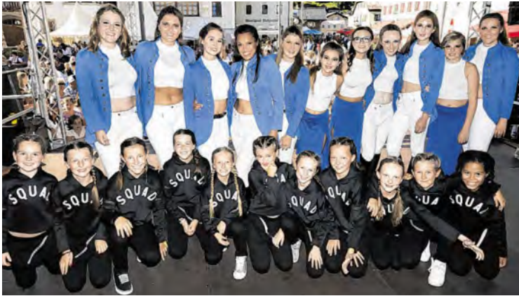
Die Tanz AG trat auf der Stadtfest-Bühne auf.