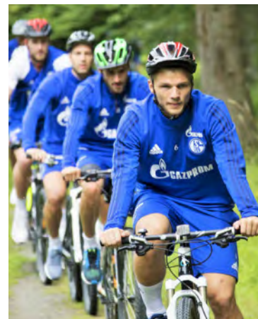
Die Stars (vorne Johannes Geis) radelten durch die Region.