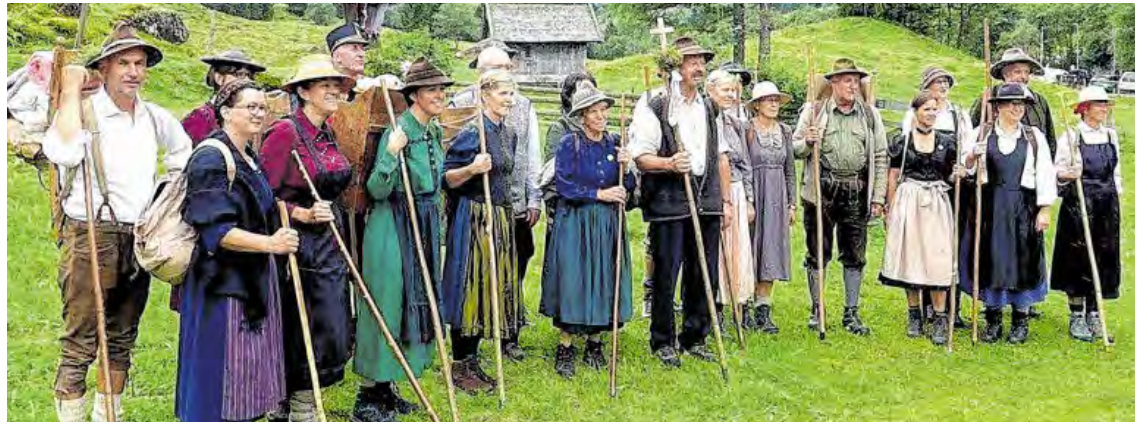
Die Teilnehmer waren auf den Spuren der Säumer unterwegs.

Mehr Infos und Fotos auf WWW.SAMER-MITTERSILL.AT