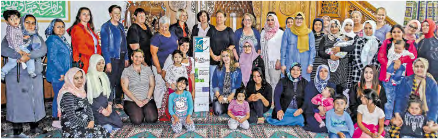
Ein buntes Bild bei der „Frauen-Tankstelle“.