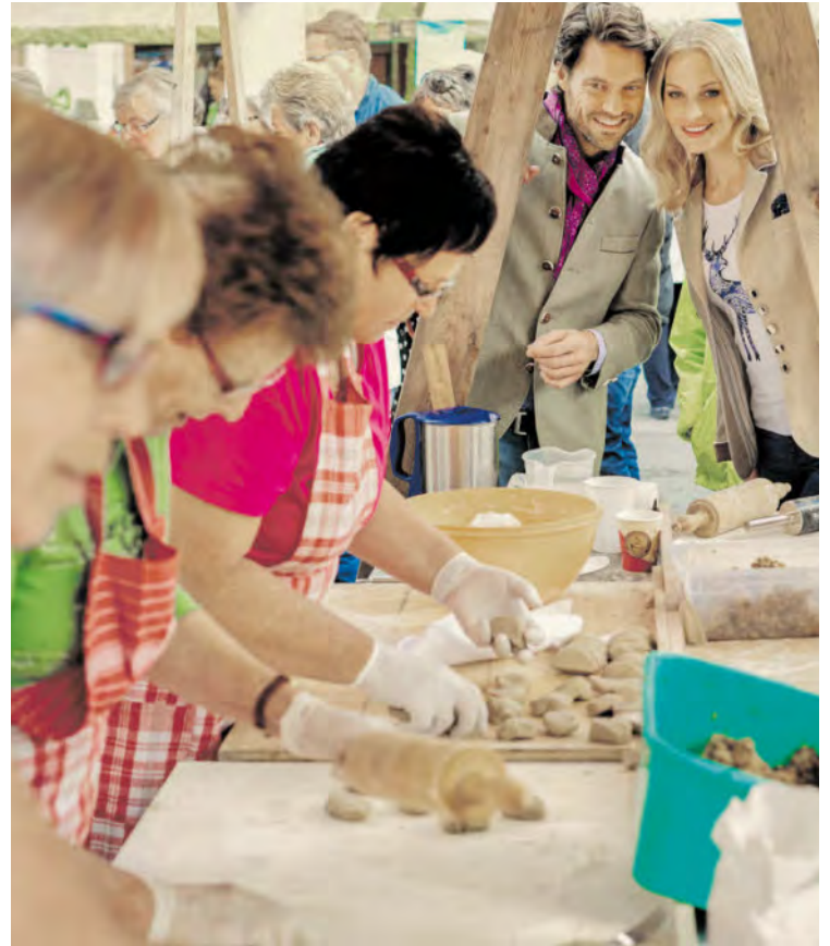
Rund 2000 Veranstaltungen finden salzburgweit anlässlich des Bauernherbstes statt – darunter auch einige im Oberpinzgau.

Am 17. September ab 11 Uhr findet dann das Herbstfest des Tauern-Blasorchesters (TBO) mit Almabtrieb beim Felberturm Museum statt. Am 1. Oktober folgt der 35. Hollersbacher Bauernmarkt, von 9. bis 14. Oktober finden die Holundertage im Kräutergarten in Hollersbach statt.