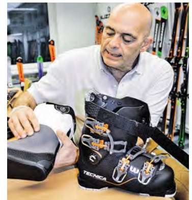
Tecnica-Skischuhe lassen sich leicht individuell anpassen.