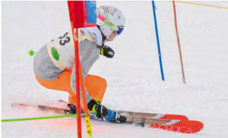
Am Resterkogel werden die Stadtmeister ermittelt.