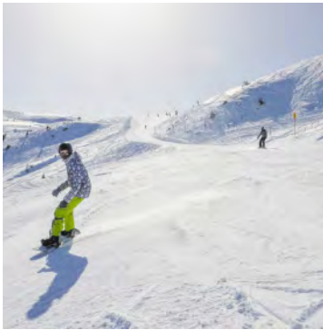
Boarder und Skifahrer genießen die großzügigen Pisten.