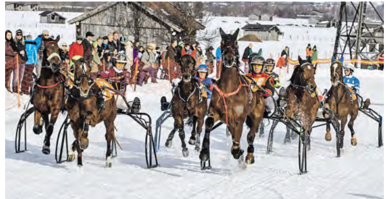
Eng ging's her im Starterfeld.