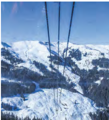
Spektakuläre Fahrt mit der 3S-Bahn auf die andere Talseite.