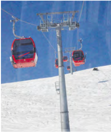
Die Panoramabahn führt bequem auf den Resterkogel.