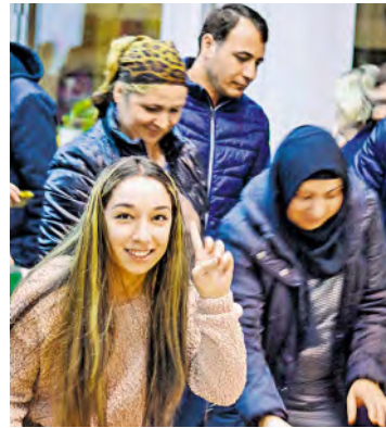
Menschen verschiedenen Alters machten mit.