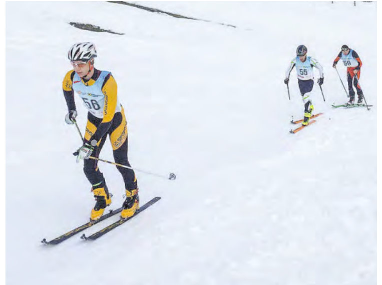
Nach dem Langlauf warten noch zwei weitere Disziplinen: Riesenslalom und Tourengehen.