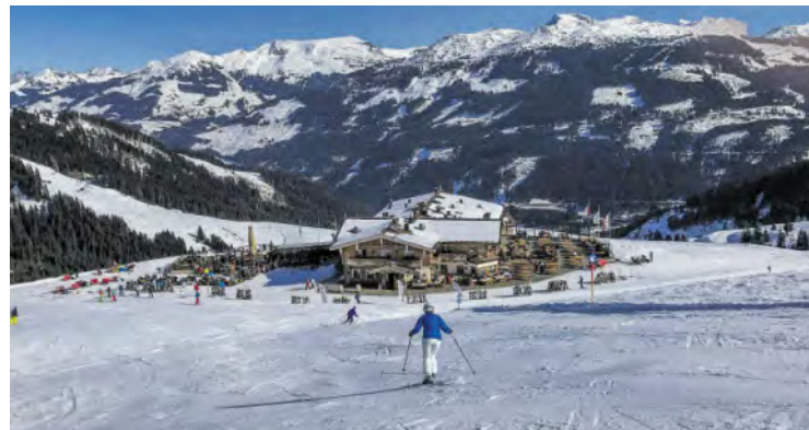
Jede Menge Restaurants und urige Hütten laden die Wintersportler ein, alle bestechen mit Ambiente und kulinarischen Köstlichkeiten.

Kitzbühel ist eine Urlaubsdestination von Weltruf, im Sog der Stadt hat sich die Pinzgauer Seite mit Mittersill und Hollersbach profiliert. Für nicht wenige Pinzgauer gilt es das Gebiet noch zu entdecken. Es lockt auch mit enormer Freundlichkeit der Mitarbeiter und vielen speziellen Tarifen, diese gibt es unter: WWW.MITTERSILL-TOURISMUS.AT