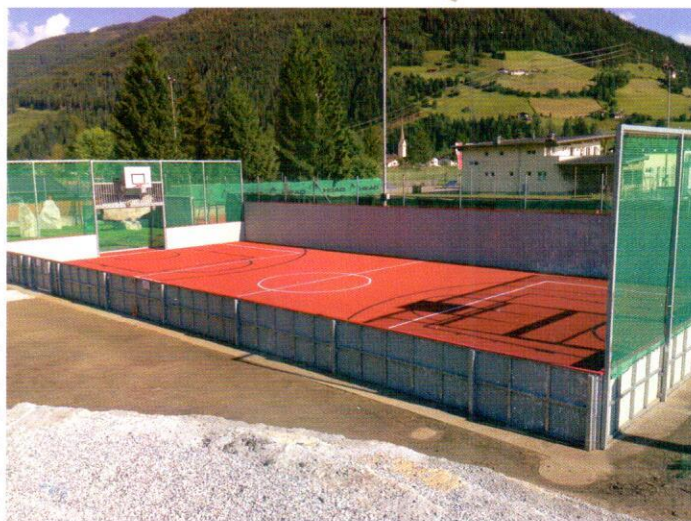
Bald fertiggestellt ist der Chillout-Platz im Sportzentrum

Die Bürger- und Trachtenmusikkapelle Mittersill feiert heuer ihr 190-jähriges Bestehen. Freuen dürfen wir uns aus diesem Anlass auf ein Konzert der Militärmusik Salzburg, das am Freitag, dem 26.07.2013 um 20.00 Uhr beim Musikpavillon stattfindet.