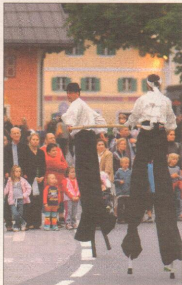
Straßenkünstler und Gaukler sorgen für viel Abwechslung.

• Tags darauf (Sonntag, 3. August) steht ebenfalls am Stadt-