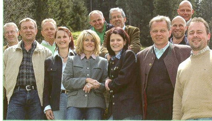
Einer der kulinarischen Nationalparkbotschafter, der Nationalparkwirt Kaltenehauser aus Hollersbach, sorgte für das ausgezeichnete gemeinsame Mittagessen nach dem Spatenstich.