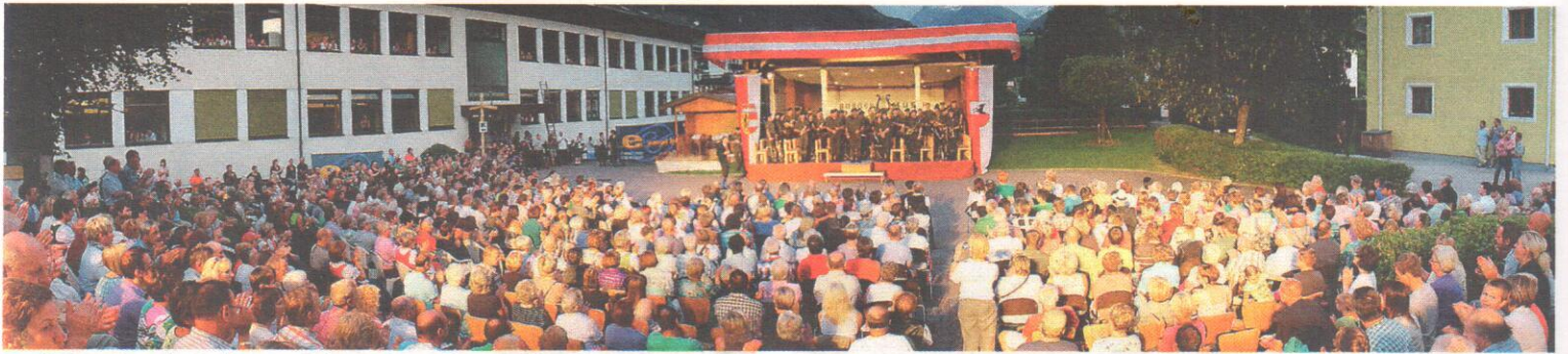
Beeindruckende Kulisse auf dem Mittersiller Pavillonplatz.