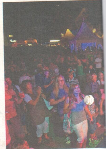
Die „Saubartln“ heizten dem Publikum

Das bunte und abwechslungsreiche Programm startete um 18 Uhr.