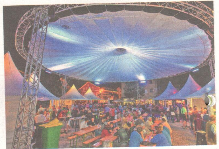
Der „Magic Sky“ spannte sich über den Stadtplatz.