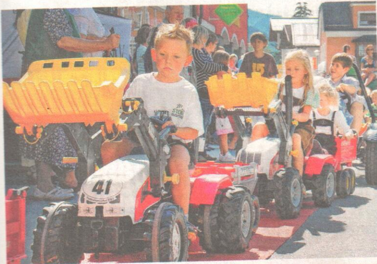
Die Trettraktortparade eröffnete das Stadtfest.