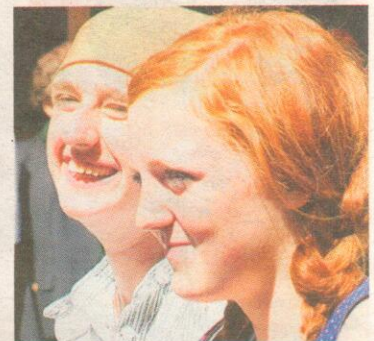
...oder war beim historischen Festumzug - hier als fleißige Mägde bei der Heumahd - mit dabei.