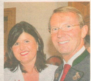
Sie lobten beim offiziellen Festakt am Freitag die Mittersiller: LH Gabi Burgstaller und LH-Stv. Wilfried Haslauer.