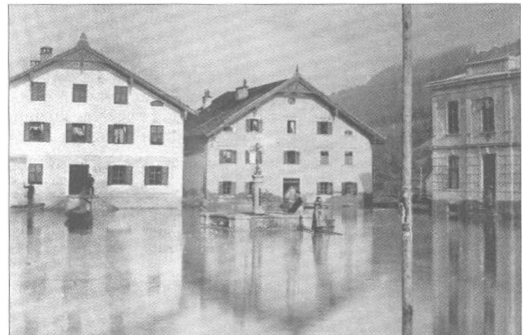
Überschwemmung am Marktplatz im Jahre 1903.

Ebenso wurden Wünsche für die Abhilfe laut und Entwürfe für eine Verbesserung eingebracht. Auch dazu schreibt Vierthaler 1816: „Zum Unglück ist man über die Mittel, die zum Ziele (der Verbesserung) führen sollen, nicht ganz einig. Viele glauben, mit der bloßen Räumung der Salza sey alles getan; andere sind dagegen der Meinung, der reißende Gebirgsstrom müsse gänzlich in ein neues Bett umgeworfen werden. Wieder andere, darunter viele denkende Pinzgauer behaupten, das Haupt-