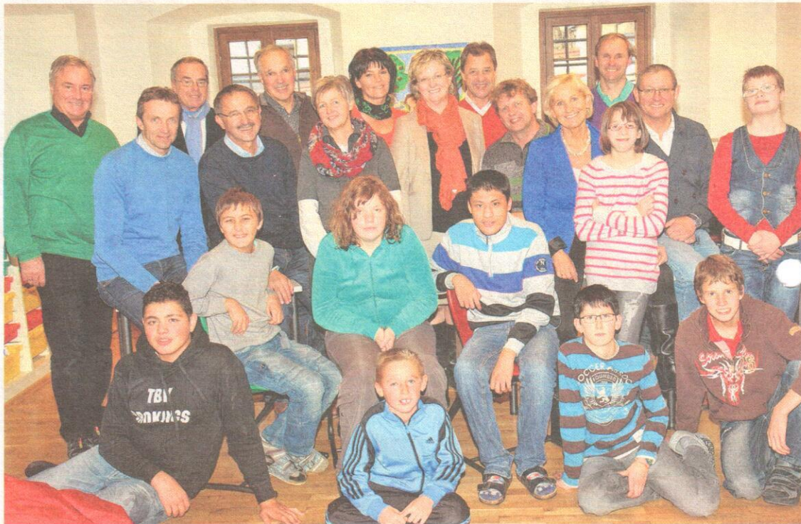
Schüler, Lehrer, Betreuer des SPZ und die Oberpinzgauer Bürgermeister.

Die Nachmittagsbetreuung selbst wird sehr abwechslungsreich gestaltet: So steht viel